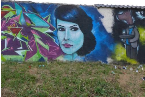
Mur d'expression sur le parking du CSC

La fin de l'été sonne toujours l'heure de la rentrée. Pour l'école et les associations, septembre marque toujours le départ d'une nouvelle aventure. Dans ce nouveau numéro d'ETTENDORF'INFOS", également disponible en version couleur sur le site internet de la commune, vous retrouverez toutes les rubriques habituelles, l'état-civil des 4 derniers mois et en dernière page, des renseignements pratiques... La rédaction vous souhaite une agréable lecture de cette quatorzième édition d'ETTENDORF'INFOS.