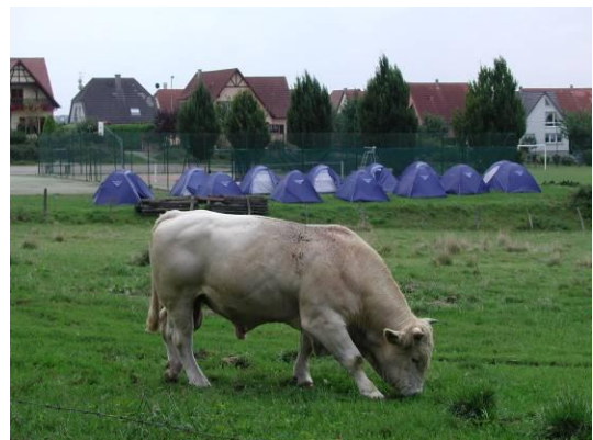
"L'aventure" au cœur de nos villages !!