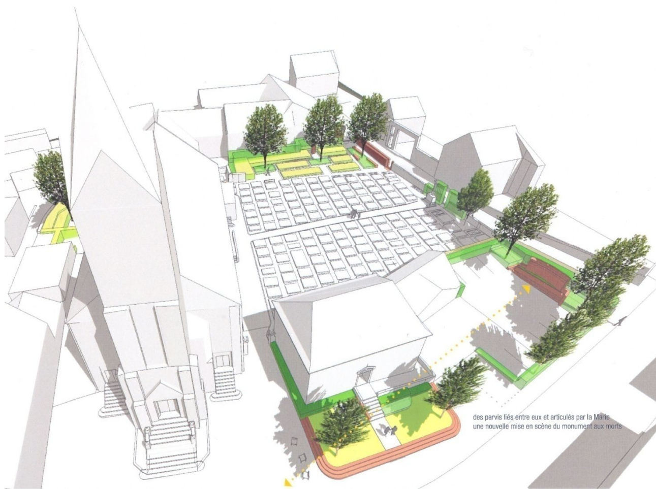
Représentation schématique du réaménagement du cimetière après son extension.

Il sera déplacé sur le parking de la mairie et le site sera aménagé pour l'accès aux personnes à mobilité réduite.