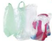
Sacs et films plastique

Les déchets ci-dessous ne vont pas dans le bac de tri